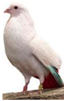
CAPITAN AK-834227 BLANCO PEÑA EL CRIO