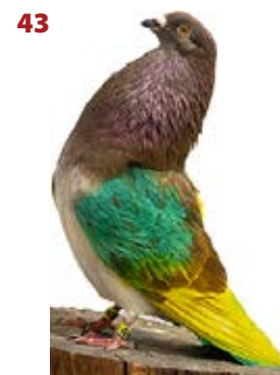
SEÑOR SHELBY AK-180596 ROJO PEÑA FAMILIA LORCA Y SOLER