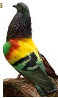
FACTOR SORPRESA AZUL AK-598866 AZUL PEÑA AMIGOS DEL PALOMO