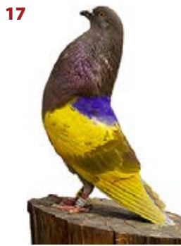
SIN FRONTERAS AL-184352 ROJO PEÑA LOS BENITOS