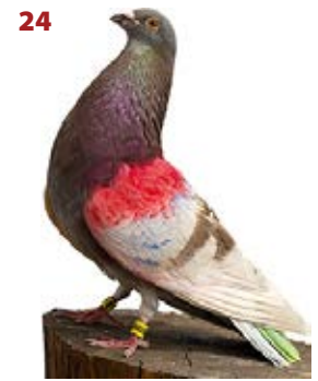
FINO AJ-968297 ROJO PEÑA APOLO Y RENATO