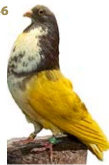
ESCAPADO AK-873267 ROJO PERA PEÑA MARIA