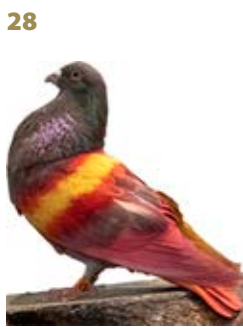
DUQUE AK-899237 ROJO PEÑA LOS CUÑAS