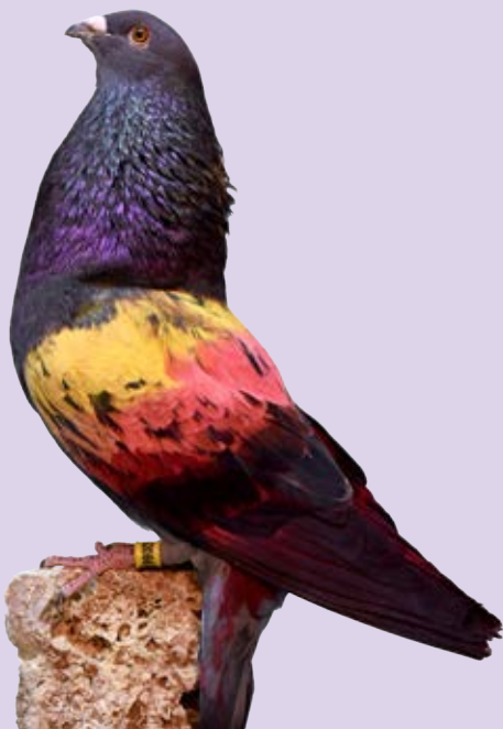
2º SORPRESAS AL-162066 ACERADO PEÑA JJ Y NIETAS