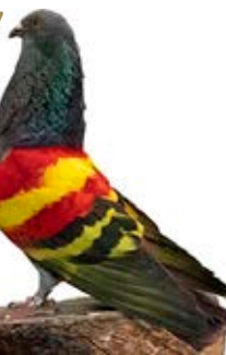
ALMIRANTE AK-133034 AZUL PEÑA MALAGUEÑOS Y LOS CONSEJOS