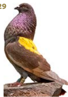
FACTOR SORPRESA ROJO AK-339391 ROJO PEÑA LA ERMITA