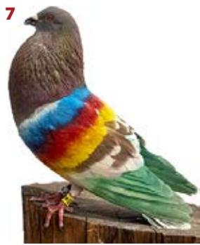
JOKER AK-838598 BAYO PEÑA ENTRESIERRAS