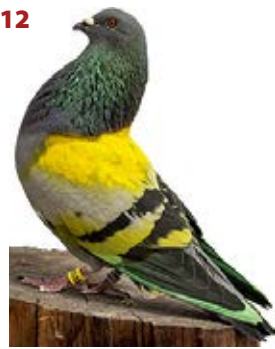
GUIRI AK-871500 AZUL TREPADO PEÑA ENTRESIERRAS