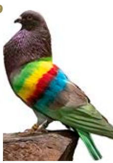
POLINESIA K-339535 ROJO PEÑA MIRIAM