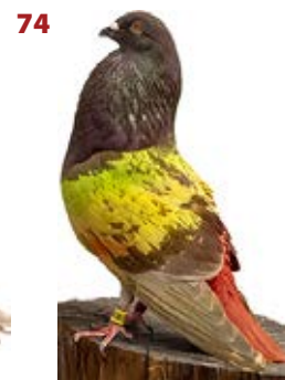
NIÑO JESUS AK-381759 ROJO PEÑA ENTRESIERRAS Y EL RATON