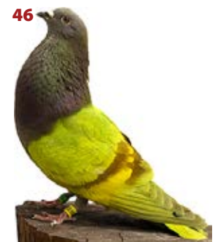
ELASTICO AK-523507 ROJO BAYO PEÑA DESARME, 3 VICTORIAS Y PABLO