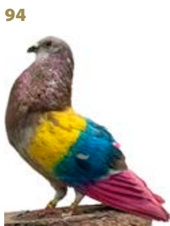
MAXIMO NIVEL AK-773610 ROJO PEÑA BELANDO