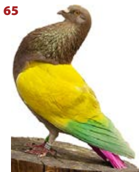
AGUA VIVA A1-379255 ROJO FEDERACIÓN VALENCIANA