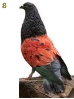
YO SIGO AK-660125 MAGAÑO EMILIANO CARPES ABENZA