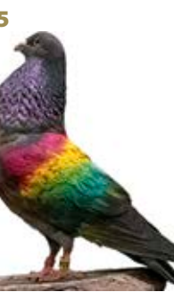
OLE TU AK-319312 MORO PEÑA LA VERACRUZ