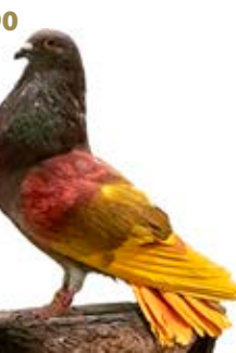
OJOS FEOS AK-745705 ROJO PEÑA LA VERACRUZ