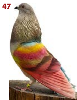
COLOR ESPERANZA AAK-833785 BAYO PEÑA EL COCHE DE LOS CHICHOS