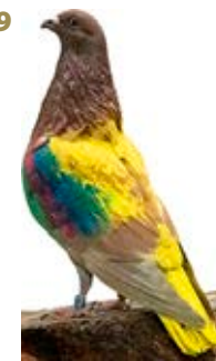
DIRECCION PROHIBIDA AK-773235 ROJO PEÑA HNOS PLATILLEROS