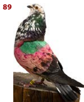
GOT TALENT AK-048233 GABINO PEÑA APOLO Y RENATO