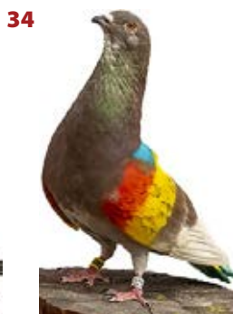
HAT TRICK AJ-840028 ROJO PEÑA ENTRESIERRAS