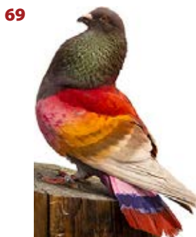
AVATAR AK-571600 ROJO PEÑA A. OLIVA-MORALES CA