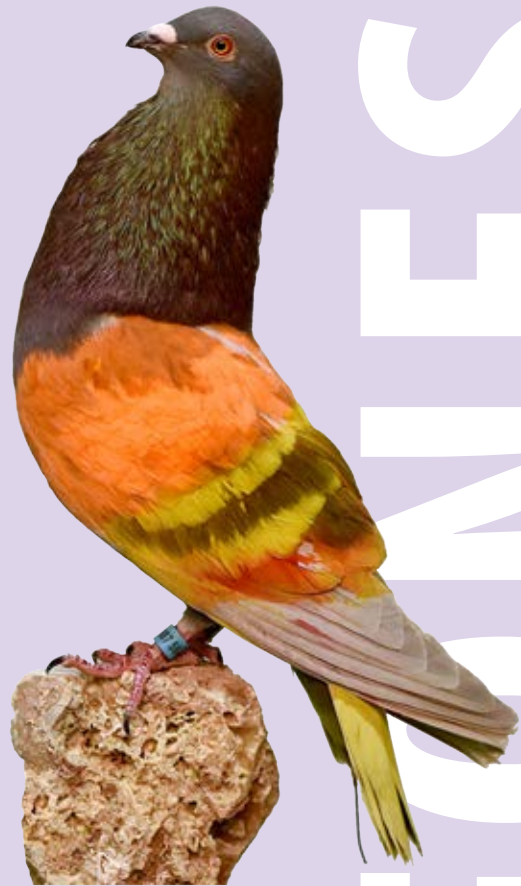
1º AMBIDIESTRO AL-004882 BAYO PAULINA GALERA CANOVAS