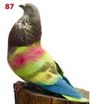
BUGATTI AK-540030 BAYO PEÑA EUROPA