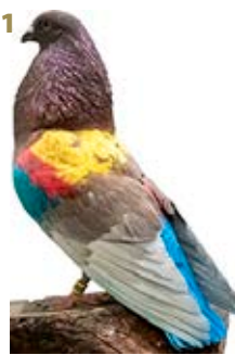
BIPOLAR AJ-704961 ROJO PEÑA SERVICAR