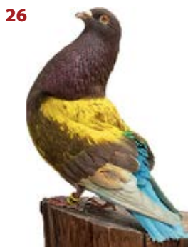
CUPIDO AK-562082 ROJO PEÑA 1ª DIVISION