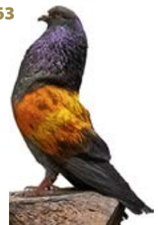
CHIPE CANELA AK-266261 ACERADO PEÑA DNI Y LOS MERLOS